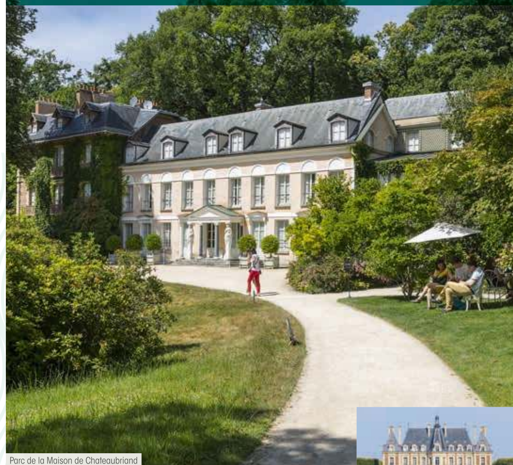
Parc de la Maison de Chateaubriand