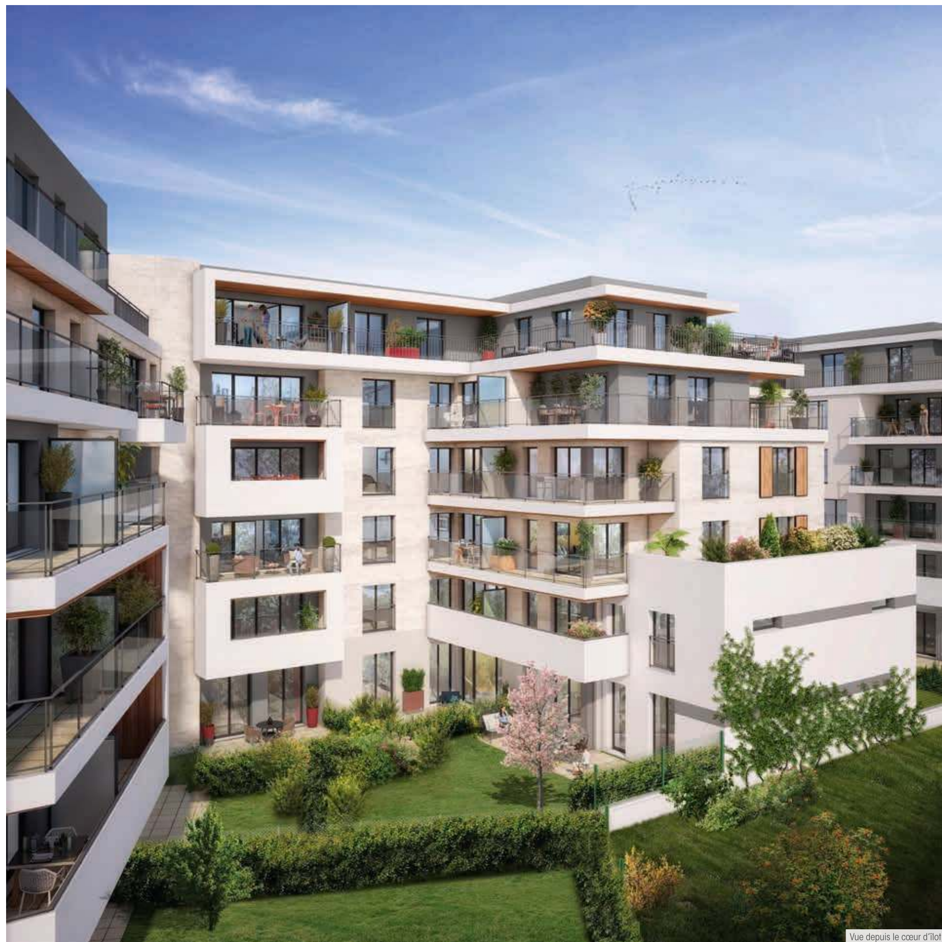
Vue depuis le cœur d'îlot

UNE INVITATION À VIVRE AUSSI BIEN À L'INTÉRIEUR QU'À L'EXTÉRIEUR, un privilège nommé « Cascade »