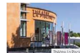
Théâtre La Piscine