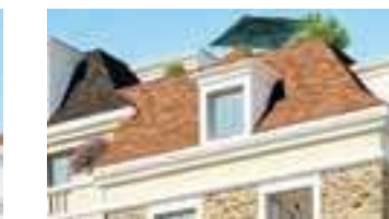
Tuiles ou ardoise