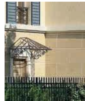
Pierre en socle