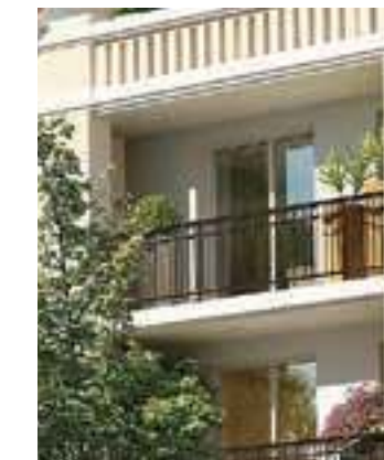
Menuiseries bois aluminium