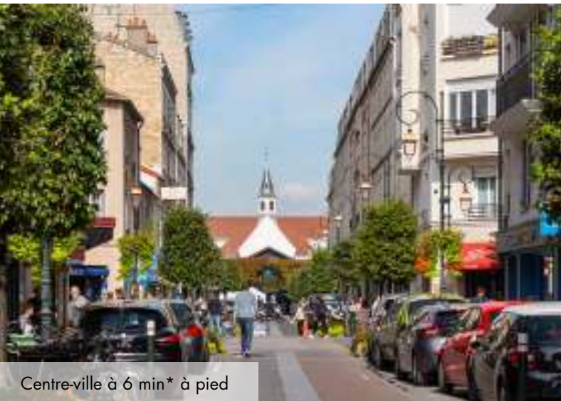
Centre-ville à 6 min* à pied

Commune à taille humaine, ses très nombreux espaces verts et ses commerces réputés lui confèrent naturellement charme et authenticité, pour un bien-être quotidien.