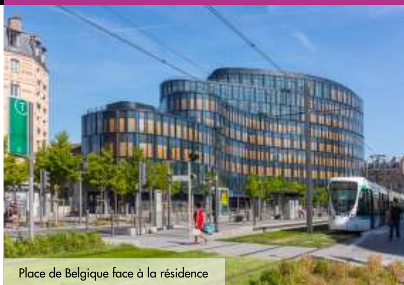
Place de Belgique face à la résidence