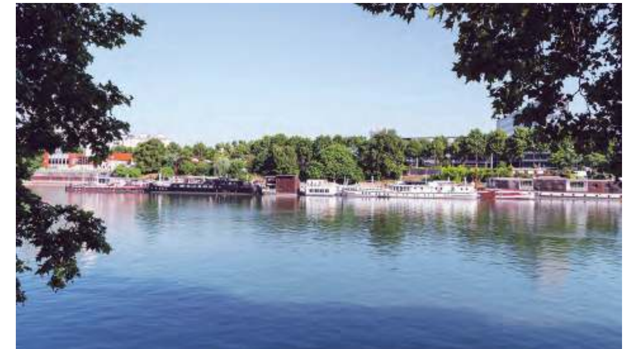
Bords de Seine à 5 min* à pied

Une promenade au Parc Roger Salengro apporte enfin une note de nature très appréciée.