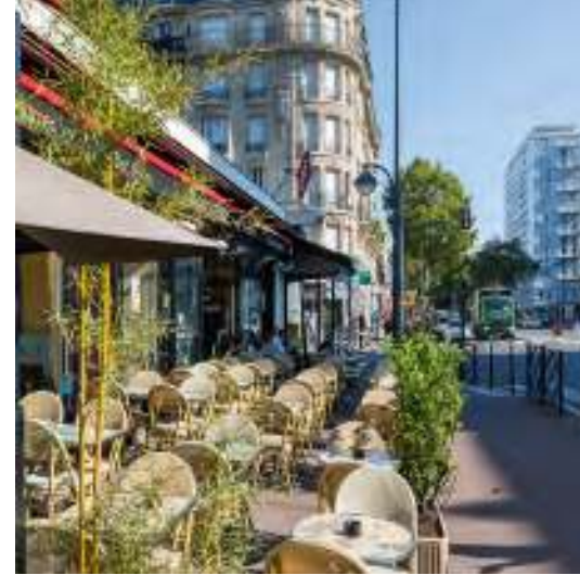
Boulevard Victor Hugo à 8 min* à vélo