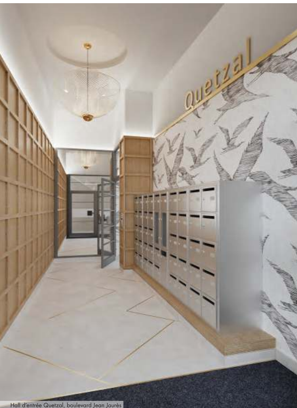
Hall d'entrée Quetzal, boulevard Jean Jaurès