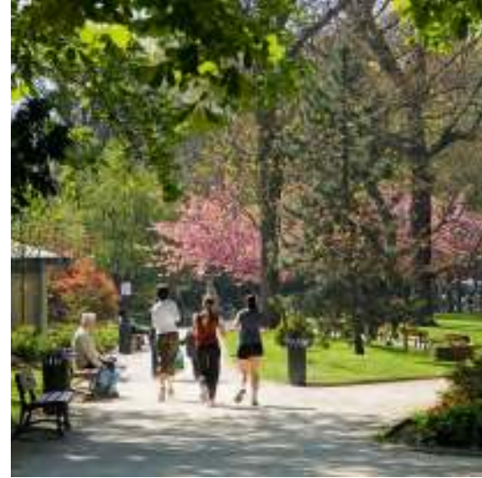
Parc Roger Salengro à 13 min* à pied