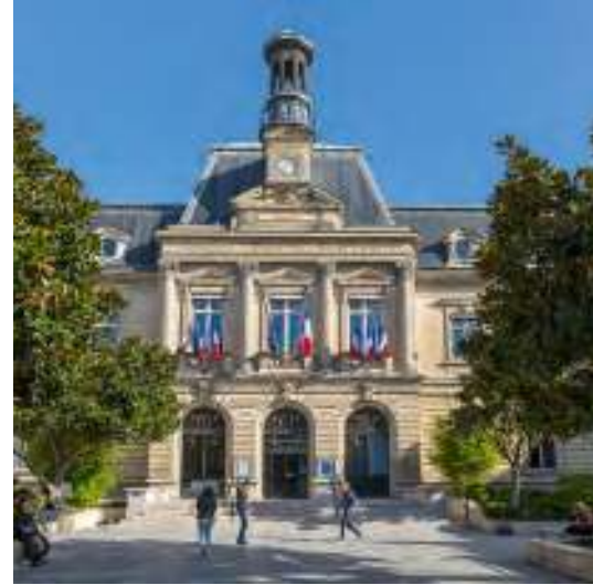
Mairie de Clichy à 7 min* à pied