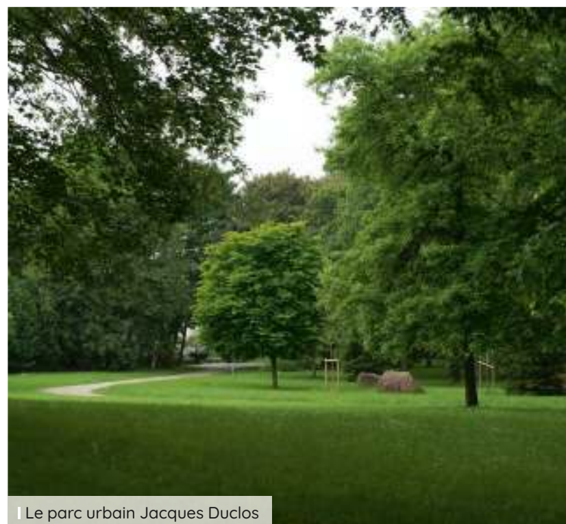
Le parc urbain Jacques Duclos

La station RER B "Gare du Blanc-Mesnil", à 14 min* à pied, ainsi que de nombreuses lignes de bus.