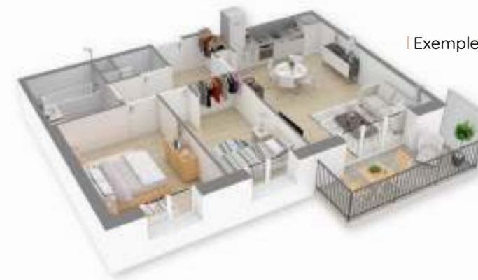
Exemple d'un appartement 3 pièces