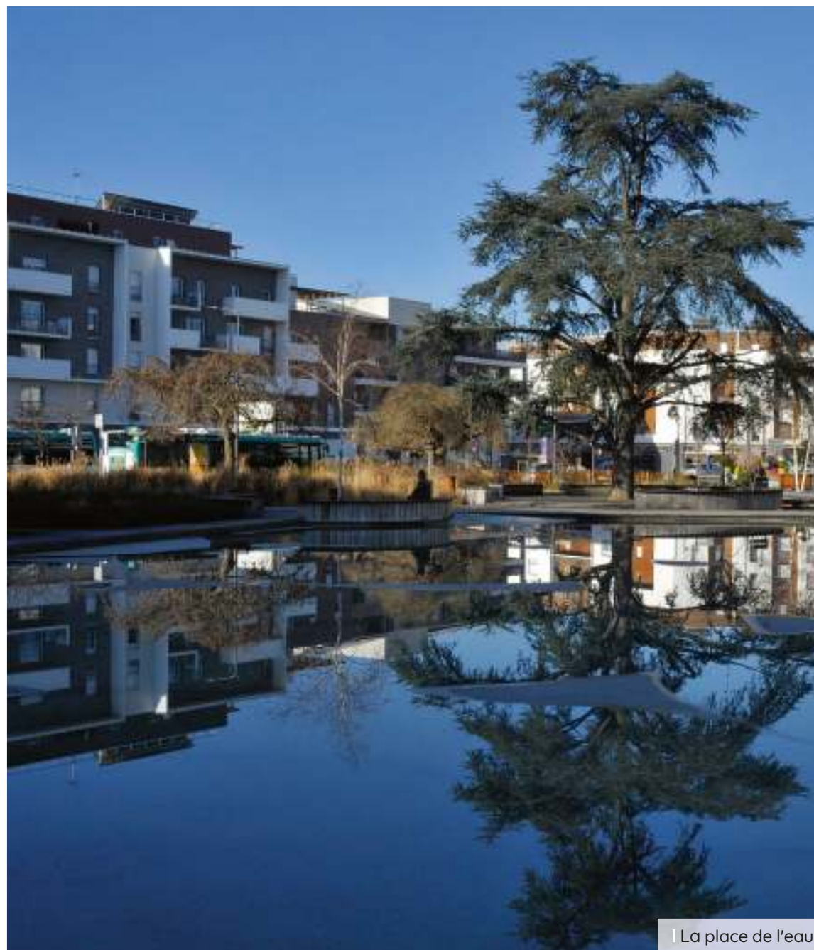
La place de l'eau

La ville du Blanc-Mesnil a réussi à innover sur de nombreux aspects pour garantir à tous ses habitants un cadre de vie calme et sécurisé et elle séduit par son rayonnement à la fois économique, culturel et sportif, ainsi que par ses nombreux espaces verts (68 hectares).