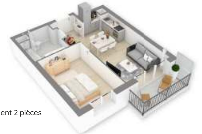
Exemple d'un appartement 2 pièces